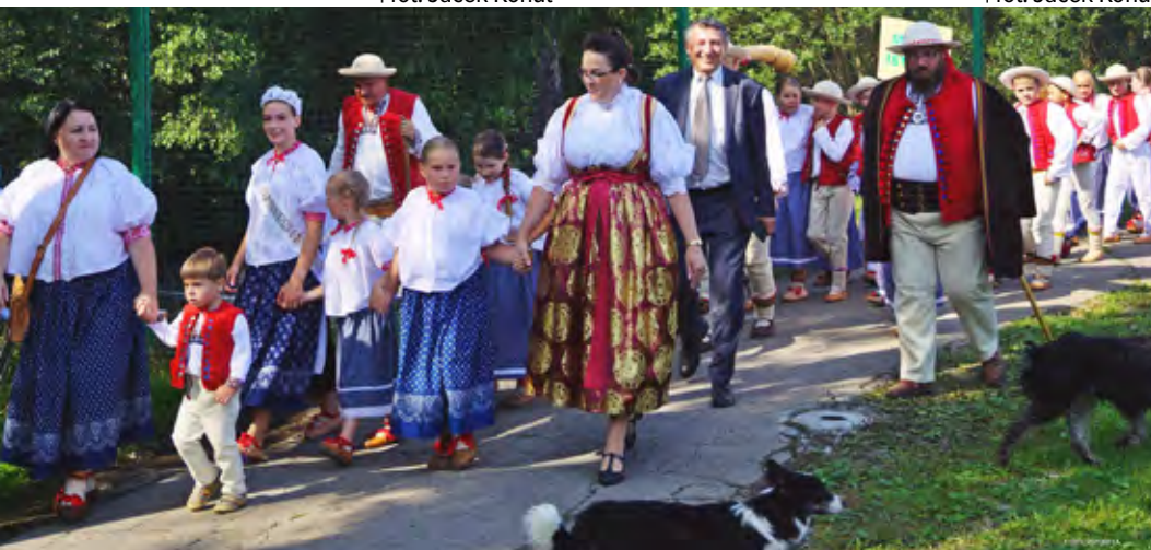
Korowód w ramach 58. TKB w Istebnej