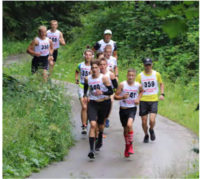
Biegacze na trasie jubileuszowego biegu

Rekordowa ilość uczestników, sportowa rywalizacja, niezapomniana atmosfera i meta na wysokości 892 m n.p.m. Takie wrażenia towarzyszyły X Jubileuszowemu Międzynarodowemu Biegowi na Tyniok organizowanemu w dniu 18 lipca 2021 r. przez Gminny Ośrodek Kultury w Istebnej.