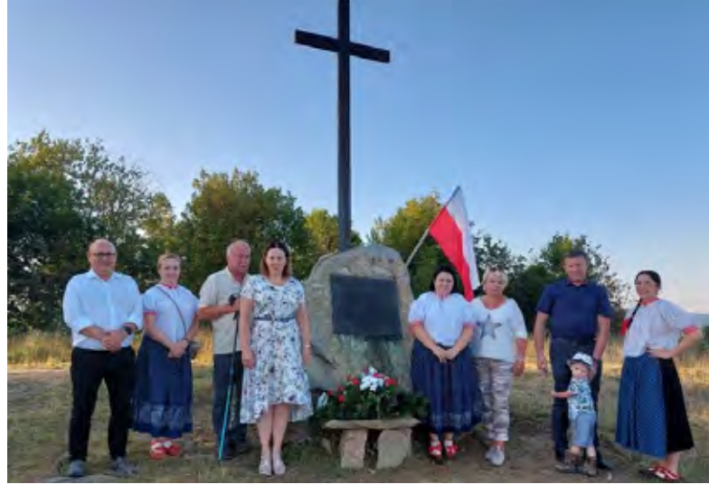
Złożenie kwiatów pod kamieniem upamiętniającym poległych powstańców

Istebna „Dzielec” 1919, tel. 47 857 37 30, dzielnicowi 47 857 37 33 KP Wisła ul. 1 Maja 44a, tel. 47 857 37 10 istebna@cieszyn.ka.policja.gov.pl wisla@cieszyn.ka.policja.gov.pl