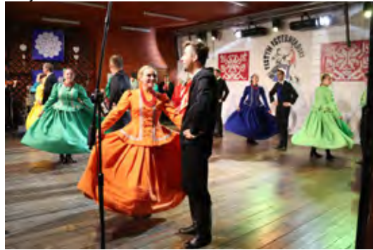
Fragment występu Zespołu Regionalnego „Rybarzowice”