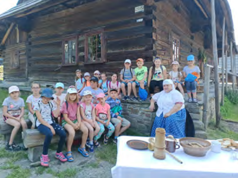
Półkolonie SP2 Istebna-Zaolzie

Dzień drugi to „Dzień zabaw wodnych”. Sprzed szkoły wyruszyliśmy pieszo do Kompleksu Zagroń Istebna na basen. Czas upłynął nam bardzo szybko na wesołej zabawie w wodzie. Potem zwiedziliśmy Mini Zoo oraz ogród roślin na terenie obiektu. Na zakończenie niektórzy zdobyli nawet szczyt Złotego Gronia, za co otrzymali małą niespodziankę.