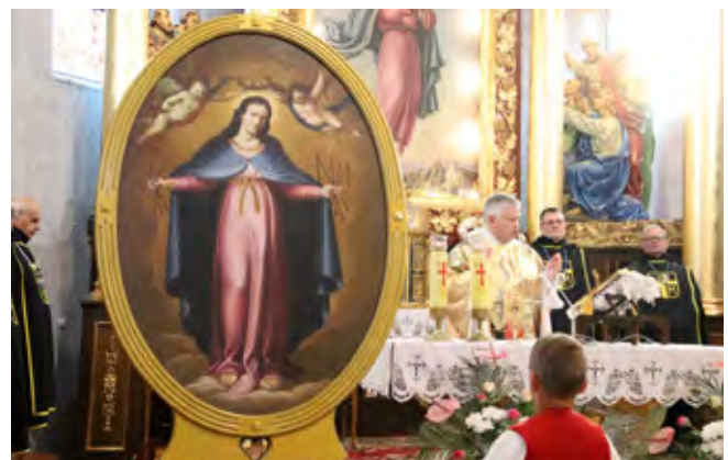
Obraz MB Łaskawej w kościele pw. Dobrego Pasterza w Istebnej