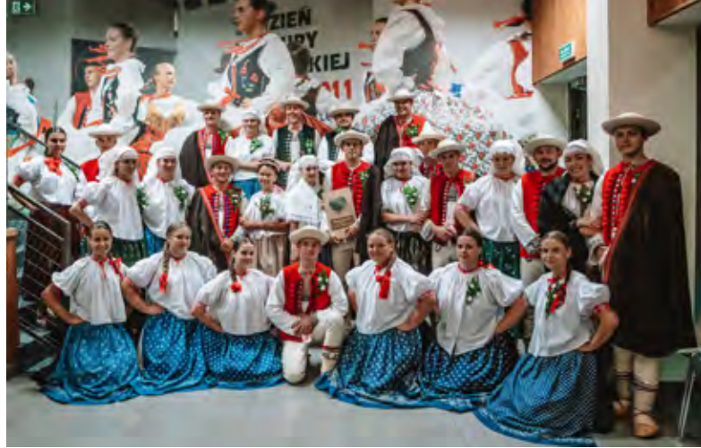
Srebrne Żywieckie Serce dla zespołu „Istebna”