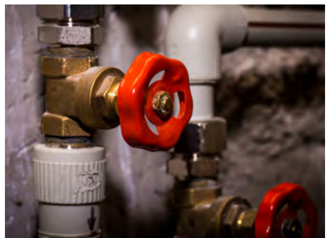
Fragment instalacji sanitarnej