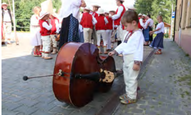
Festyn Istebniański – korowód

Pod sceną można także było obejrzyć wystawę „Festyn Istebniański w fotografii Waldemara Kompały” i kadry z minionych edycji imprezy.