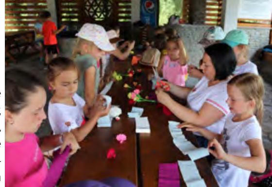
Półkolonie GOK Istebna

dzieciom pasterskie tradycyjne instrumenty, opowiedział o tym, z czego są wykonane fujarki, gajdy czy trombita, i zagrał na nich tradycyjne melodie.