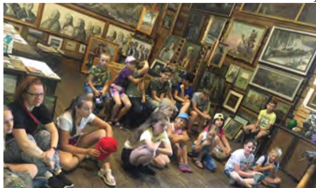
Półkolonie ZSP Istebna