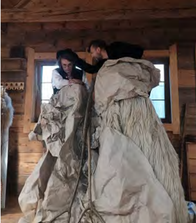
Przedstawienie „Czarnoksiężnik” w Jaworzynie

„Czarnoksiężnik” jest więc nie tylko opowieścią o „baczy, dziarskim i młodym”, który poczuł się „królem gór”, a potem wszystko stracił, ale także o nas samych i naszych kłopotach z zachowaniem własnej tożsamości. Kim jesteśmy i jaki to ma związek z miejscem, w którym się wychowaliśmy? Dlaczego tak niewiele wystarczy, abyśmy dali się ponieść złudnym hasłom, pozorom niezwykłości, po których zostaje tylko poczucie straty? „Czarnoksiężnik” Grima opowiada o tym, jak łatwo jest ulec manipulacji, nasza rekonstrukcja zmierzała jednak do poszukiwania pociechy i nadziei. Być może osiągnęliśmy ten cel, ponieważ po każdym przedstawieniu odbieraliśmy wiele serdecznych gestów i słów, widzowie i aktorzy długo ze sobą rozmawiali, a atmosfera wzajemnej życzliwości i dobrego nastroju sprawiła, że mamy ogromną ochotę dalej wymyślać i tworzyć kolejne przedstawienia.