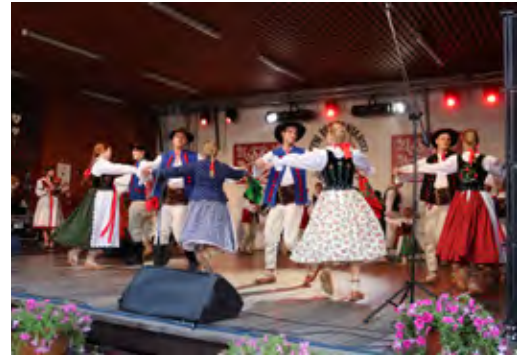
Fragment występu Zespołu Regionalnego „Spod Kikuli”