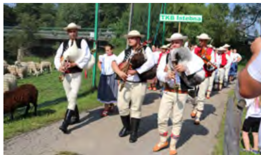
Zespół Regionalny „Istebna” podczas korowodu