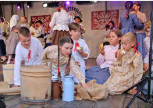
Fragment występu Zespołu Regionalnego „Juzyna” z Zawoi