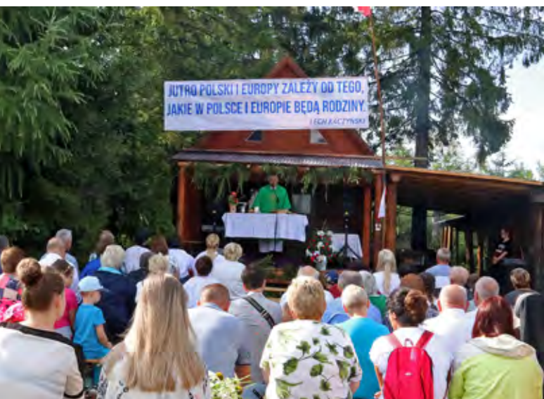
Plenerowa msza święta za ojczyznę