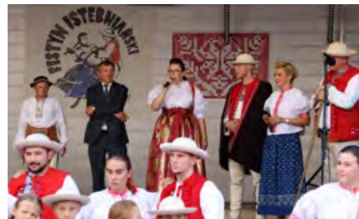
Oficjalne otwarcie II dnia XXVI Festynu Istebniańskiego