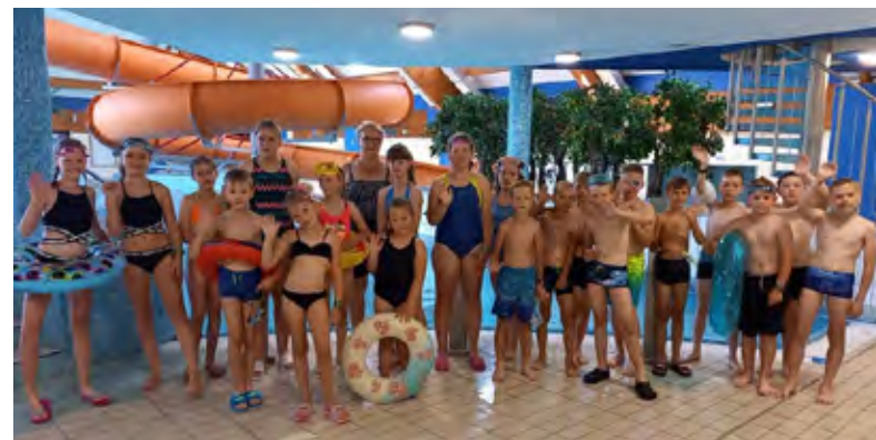
Półkolonie SP1 Koniaków