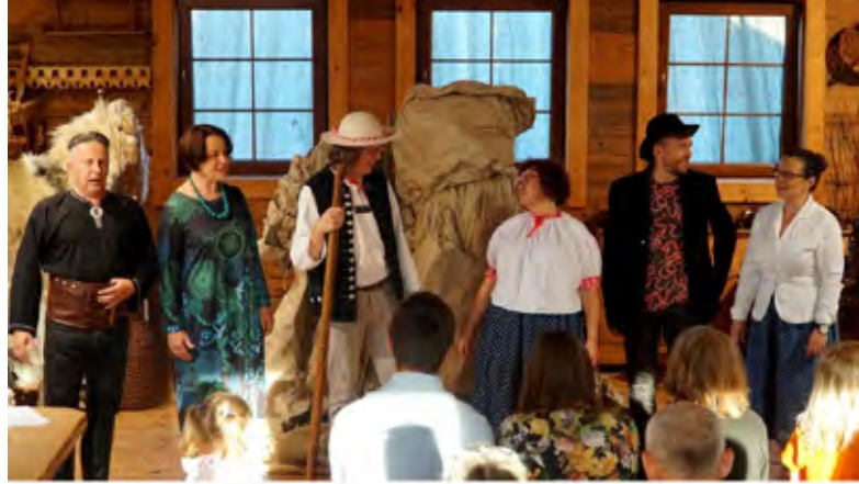
Przedstawienie „Czarnoksiężnik” w Koniakowie