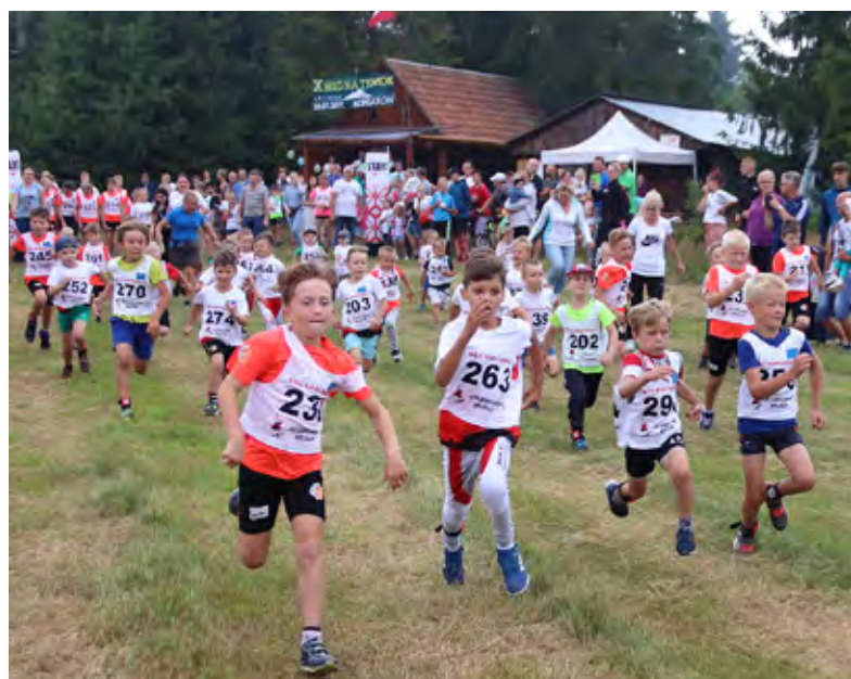
Młodzi biegacze na trasie Biegu na Tyniok