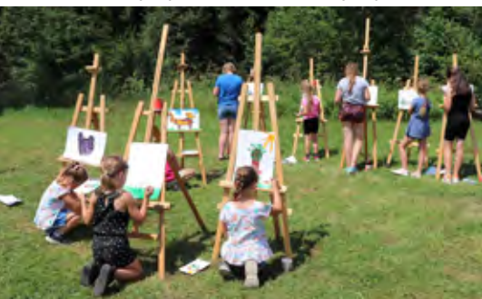
Półkolonie GOK Istebna

Pierwszego dnia dzieci spotkały się w Amfiteatrze „Pod Skocznią” w Istebnej. Podzieliliśmy się na grupy, z których każda wybrała swoją nazwę, dzieci ustaliły też „reguły gry” – 5 złotych zasad, których miały przestrzegać w czasie wspólnej zabawy. Nie brakło odrobiny rywalizacji, ćwiczeń poprawiających koordynację i integrujących. Można było postrzelać z łuku, rozegrać emocjonujący mecz piłki nożnej czy pobawić się z chustą animacyjną.