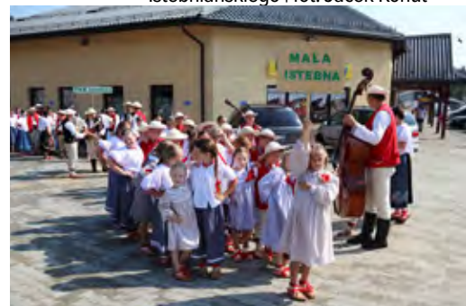
Korowód w ramach 58. TKB w Istebnej, zespół „Mała Istebna”