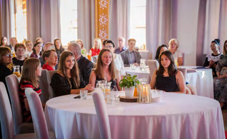
II Gala Sportu