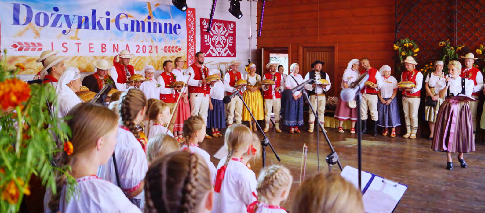
Dożynki Gminne 2021, gazdowie placów I fot. Bronka Polok x2