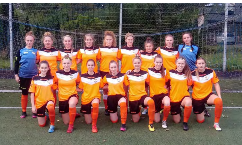
UKKS Istebna | fot. arch. klubu

29.09.21 UKKS Istebna – Czarni II Sosnowiec 0:4