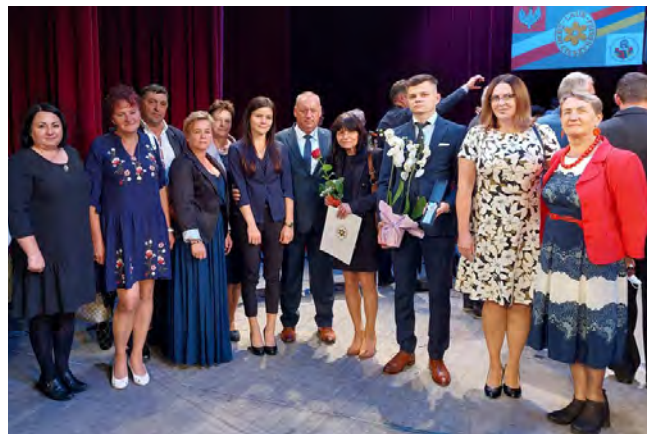
Uroczystość wręczenia Laurów Ziemi Cieszyńskiej przyznanych w roku 2020

W piątek, 17 września 2021 r., w Teatrze im. Adama Mickiewicza w Cieszynie odbyła się uroczystość wręczenia Laurów Ziemi Cieszyńskiej przyznanych w roku 2020. Wydarzenie to w roku ubiegłym miało jedynie charakter online ze względu na panującą wówczas trudną sytuację epidemiologiczną.