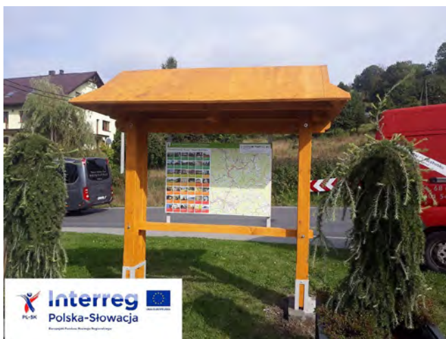
Tablica przy parkingu pod Grapą w Istebnej

W ramach projektu pn. „ Promocja dziedzictwa przyrodniczego i kulturowego Gminy Istebna oraz regionu Kysuc i Małej Fatry ” realizowanego przez Gminę Istebna wraz z partnerem słowackim – Kysucké Museum w Čadci powstały cztery tablice drewniane z mapą poglądową atrakcji gminy Istebna oraz regionu Kysuc i Małej Fatry. Opracowano także ulotkę i 40-stronicowy folder w języku polskim i słowackim przedstawiający dziedzictwo kulturowe i przyrodnicze regionu pogranicza. Folder oraz ulotki są dostępne w Gminnym Ośrodku Kultury i będą rozdysponowane nieodpłatnie dla mieszkańców i turystów.