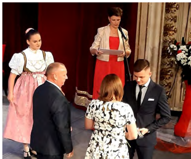
Uroczystość wręczenia Laurów Ziemi Cieszyńskiej przyznanych w roku 2020