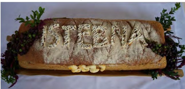
Święto Chleba w Warszawie, na zdjęciu okazjonalny bochen chleba upieczony przez piekarnię Frada z Istebnej

Na miejscu można było zobaczyć wiele ciekawych występów, między innymi fantastycznie odegrane Wesele Krzemienickie czy świetny tatarski zespół muzyczny Buńczuk, a także stoiska z chlebami, miodami, haftem łowickim czy tkactwem dwuosnowowym. Wydarzeniu towarzyszyła miła, radosna atmosfera i słoneczna pogoda.