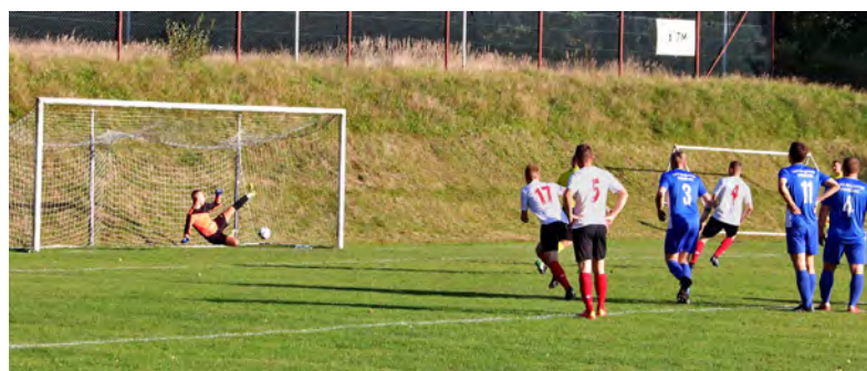
Mecz APN Góral Istebna – Błękitni Pierściec 5:1