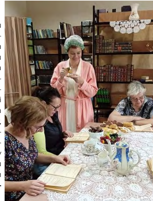
Narodowe Czytanie w Bibliotece Publicznej

Już od 10 lat, we wrześniu ma miejsce Narodowe Czytanie. Ta akcja promująca największe dzieła z kanonu polskiej literatury została zainicjowana przez prezydenta Bronisława Komorowskiego. Na przestrzeni 10 lat czytano już „Pana Tadeusza”, dzieła Fredry, „Trylogię”, Lalkę, „Quo Vadis”, „Wesele”, „Przedwiośnie”, nowele polskie czy „Balladynę”. W tym roku mierzyliśmy się z tekstem Gabrieli Zapolskiej „ Moralność Pani Dulskiej ”.